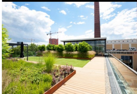
Strijp T Eindhoven